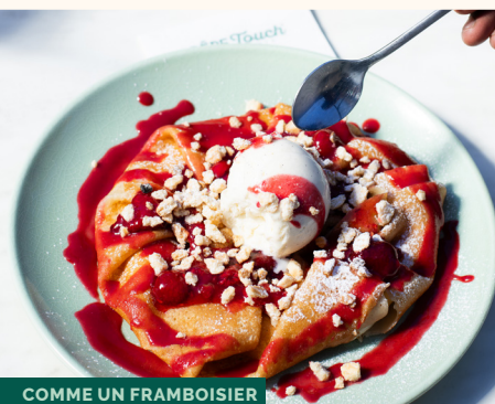
COMME UN FRAMBOISIER