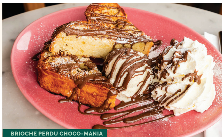
BRIOCHE PERDU CHOCO-MANIA

Pâte à cookie légèrement cuite, cœur fondant au chocolat au lait, Nutella chaud et boule de glace vanille Bourbon