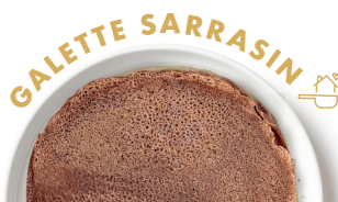
FARINE DE BLÉ NOIR SANS GLUTEN