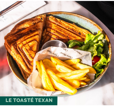
LE TOASTÉ TEXAN

FRAICHEMENT CUISINÉ CHOISISSEZ VOTRE DESTINATION GOURMANDE