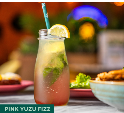
PINK YUZU FIZZ