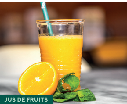
JUS DE FRUITS