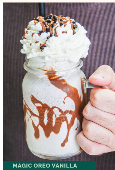
MAGIC OREO VANILLA