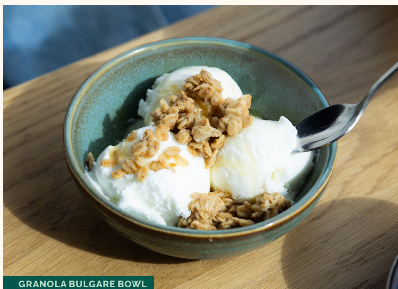
GRANOLA BULGARE BOWL