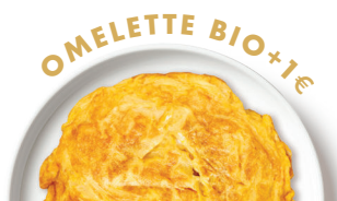
3 ŒUFS BIO PLEIN AIR