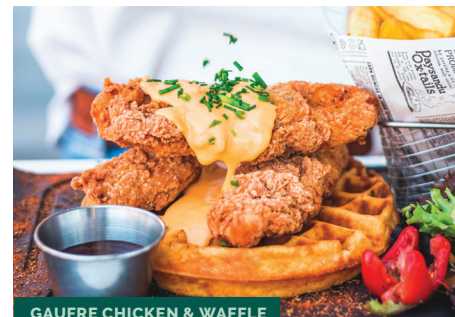
GAUFRE CHICKEN & WAFFLE

Lardons fumés ou poulet* à la crème, pommes de terre vapeur, fromage raclette, oignons caramélisés, le tout sur gaufre toastée, sauce mayonnaise, french fries dorés, salade fraîche et croquante