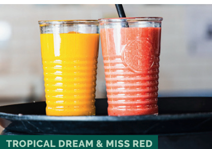
TROPICAL DREAM & MISS RED