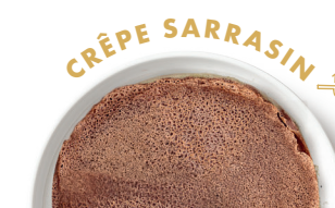
FARINE DE BLÉ NOIR SANS GLUTEN